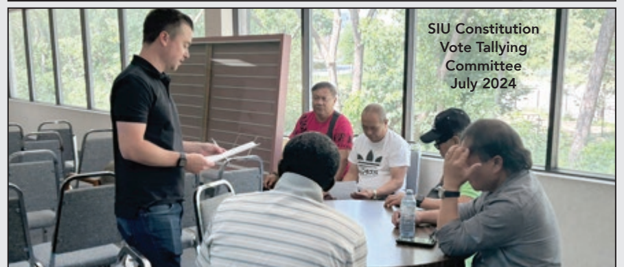
SIU Constitution Vote Tallying Committee July 2024