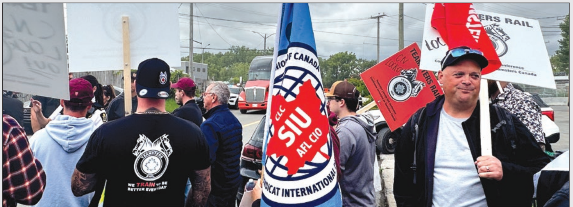
SIU at CN Demonstration in Montreal