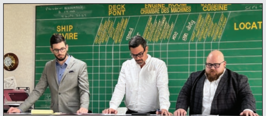
SIU officials at Montreal Membership Meeting held on September 9, 2024