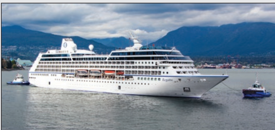
Ocean BC Tugs #2- Assiting Cruise Regatta Cruise Ship Vancouver.