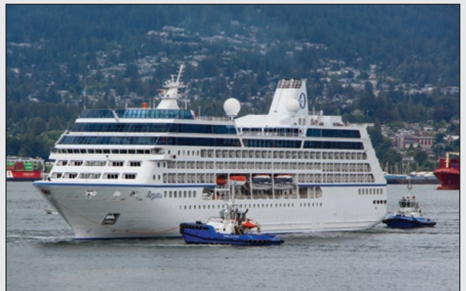
Ocean BC Tugs #1- Assisting Cruise Regatta Cruise Ship Vancouver