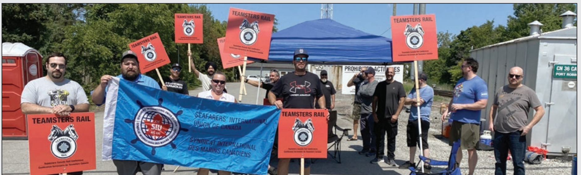
SIU joining CN Demonstration in Niagara