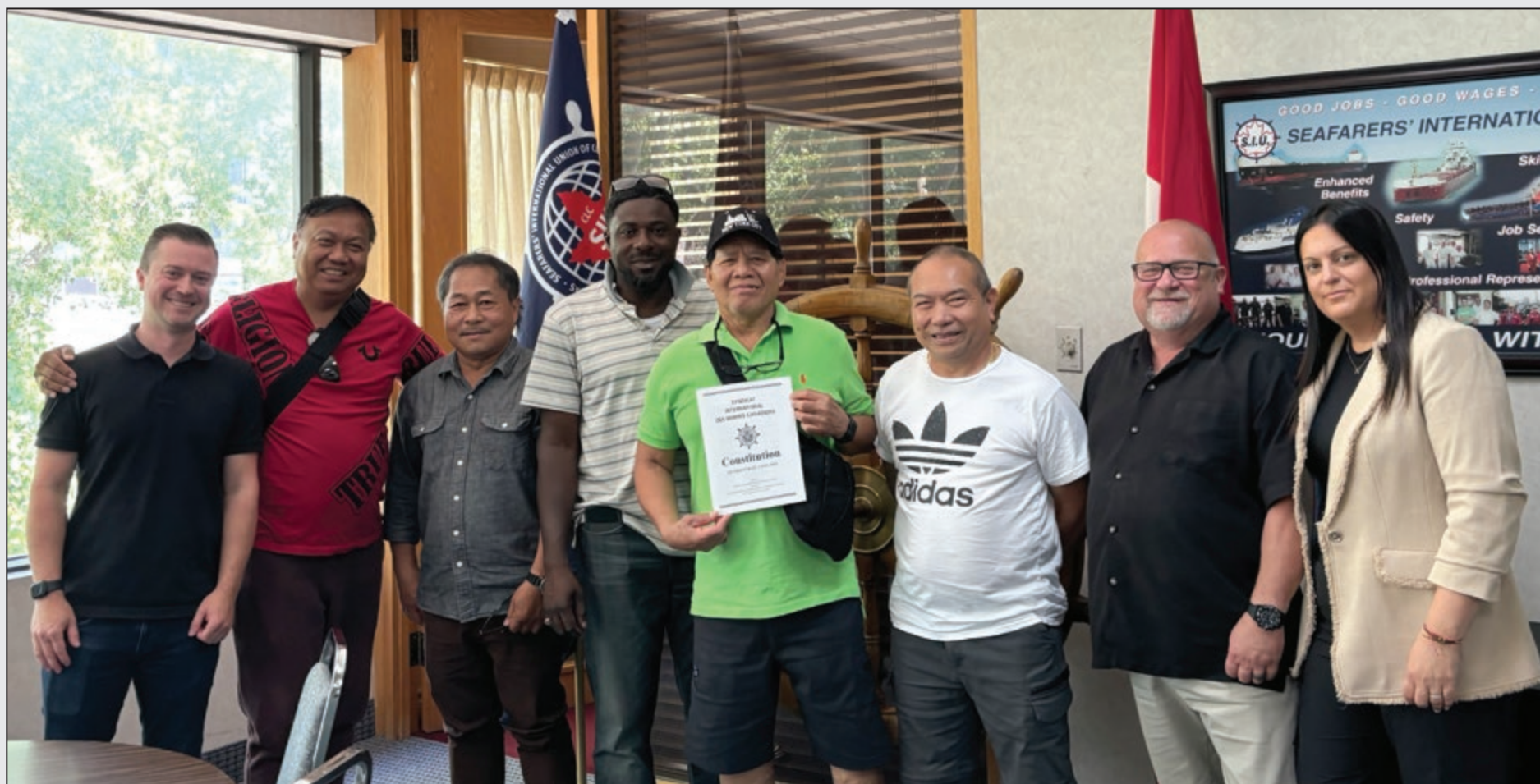
SIU Constitution Vote Tallying Committee - July 2024