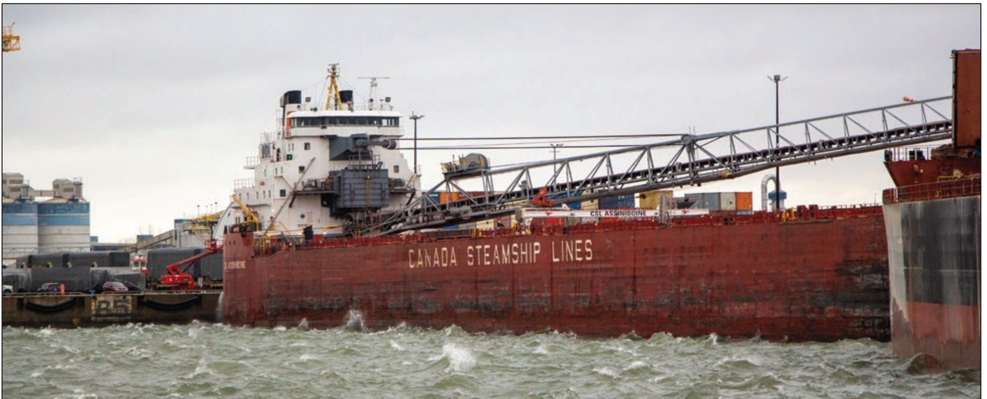
CSL Assinioine - Bécancour (Choppy Water #1)