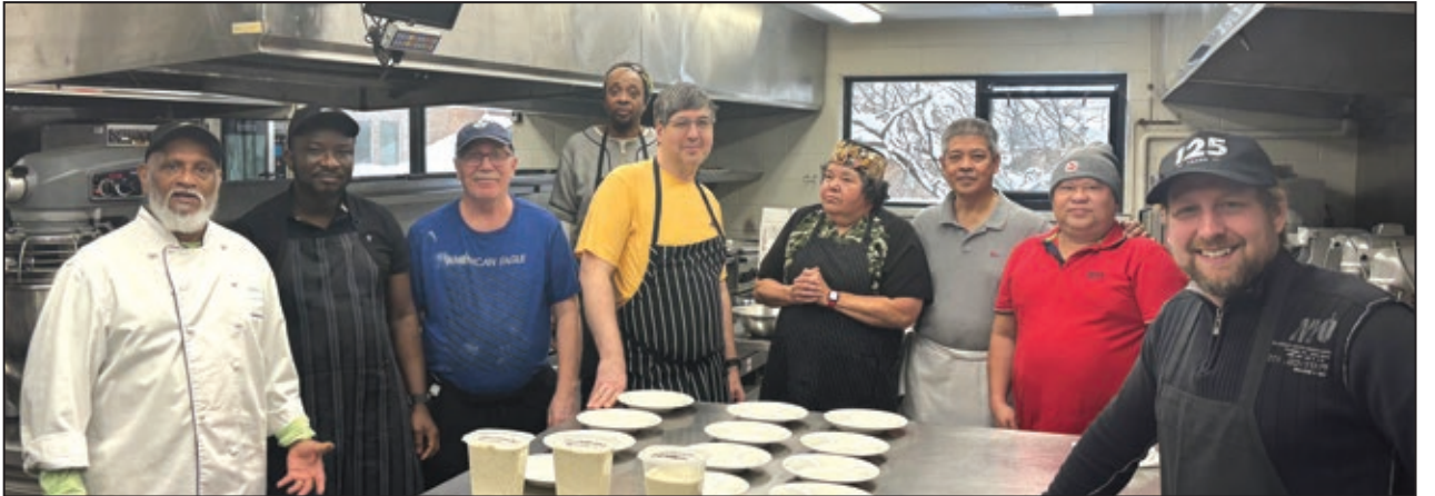
2025 Galley Management course