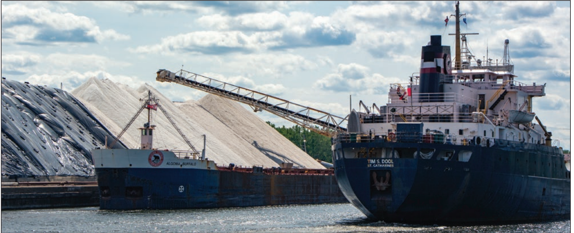
Tim S Dool & Algoma Buffalo - Côte-Ste-Catherine) - Shouthshore Canal #3