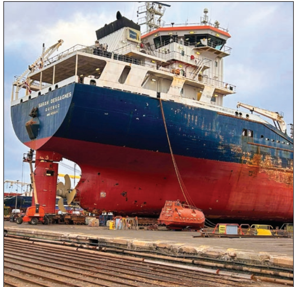
Sarah Desgagnés - dry dock Las Palmas, Spain