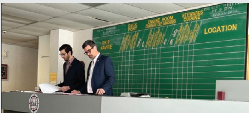
SIU Membership Meeting in Montreal in February 2025.