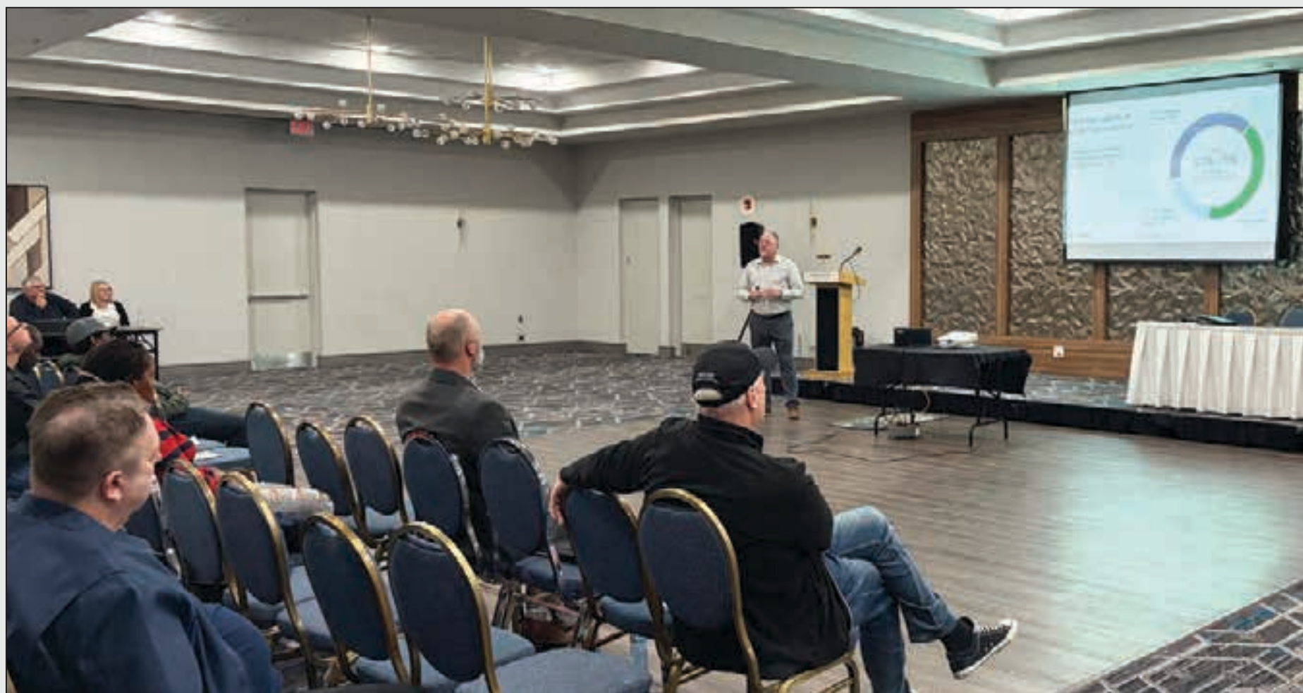
Manulife presenting to members at a recent membership meeting in Niagara