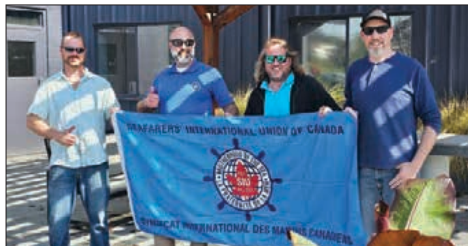
Amrize collective bargaining.

We have also issued official notice to bargain to Trident Navigation. Proposals and committee volunteers have been coming in, and we will be compiling these into a draft proposal document for members to review shortly. Once we have