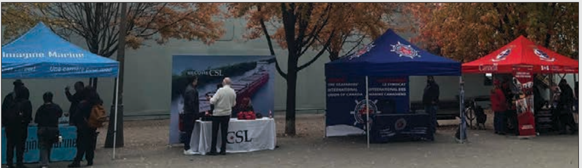
SIU Canada booth at the Marine Careers Expo