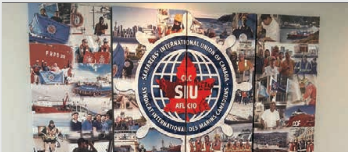
Mural featured at the new SIU Canada HQ office